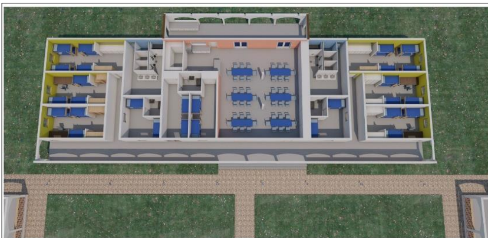
Vue des aménagements intérieurs