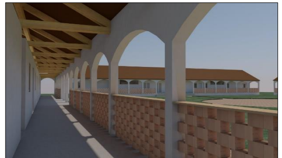
Vue depuis la galerie extérieure

Des dortoirs pour les éducateurs, y compris leurs propres installations sanitaires, sont disponibles. Les salles de bains générales sont équipées de lavabos, douches et WC. Le grand espace extérieur offre suffisamment d'espace pour les jeux et les activités de plein air.