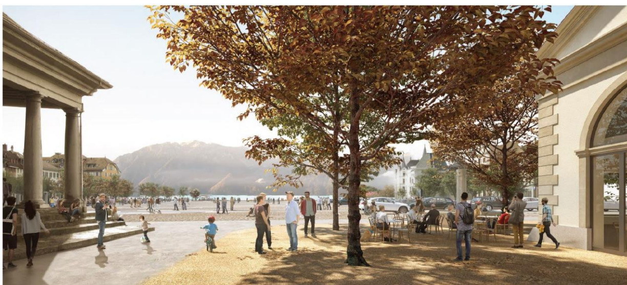
Place du Marché Vevey