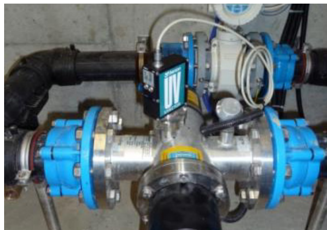
Impianto di trattamento dell'acqua

Ufficio Federale delle Strade USTRA Bellinzona