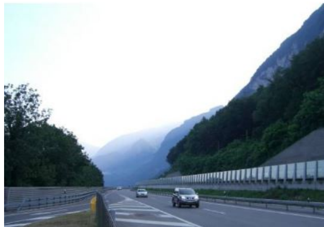
Ripari fonici esistenti