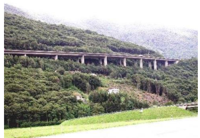
Viadotto dei Ronchi