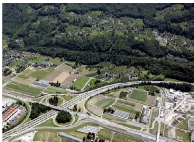
Svincolo Bellinzona Sud