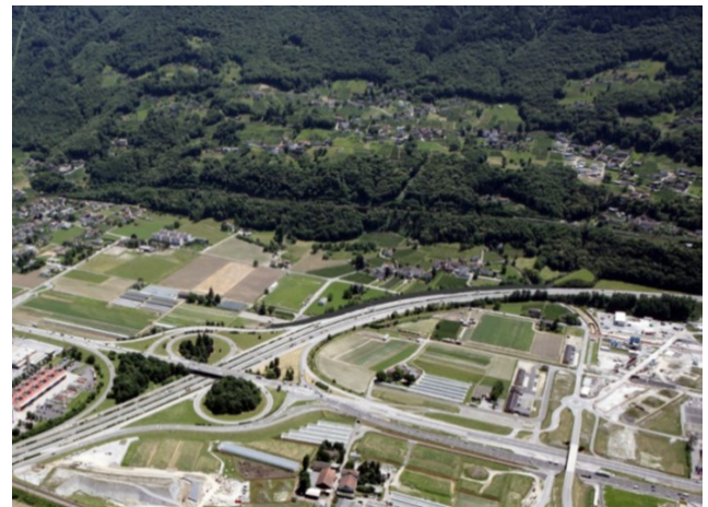
Svincolo autostradale Bellinzona Sud