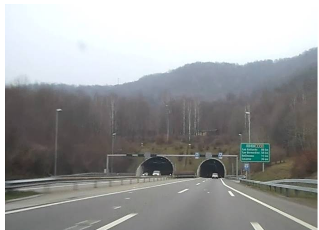
Portale Ceneri Sud