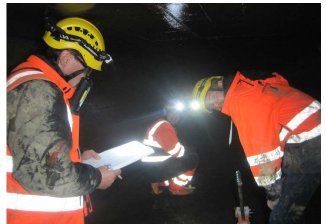
Inspektionsteam bei Aufnahmen im Druckstollen