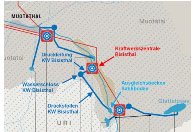
Situation Kraftwerksanlage Bisisthal

Elektrizitätswerk des Bezirks Schwyz AG (EBS)