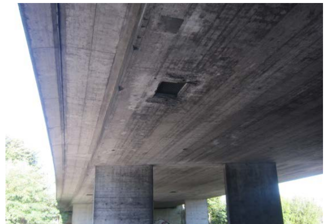
Überführung A14, Untersicht mit Einstiegsöffnungen in Hohlkästen