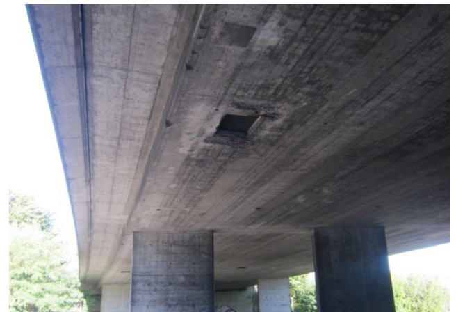
Überführung A14, Untersicht mit Einstiegsöffnungen in Hohlkästen